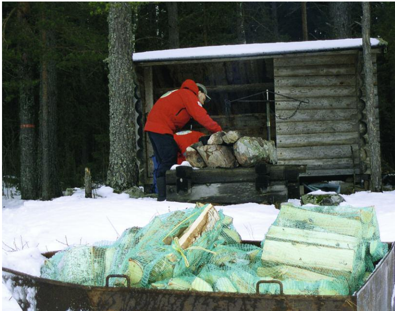
Ved till brasan. När personal vid nationalparken är ute på tillsyn passar de ofta på att fylla på ved i vindskydden eller göra något annat praktiskt.