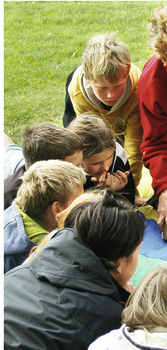
Rovdjursfunderingar runt ett äkta björnkranium. Från vänster: Vad äter en björn? Hur klarar björnar vintern?